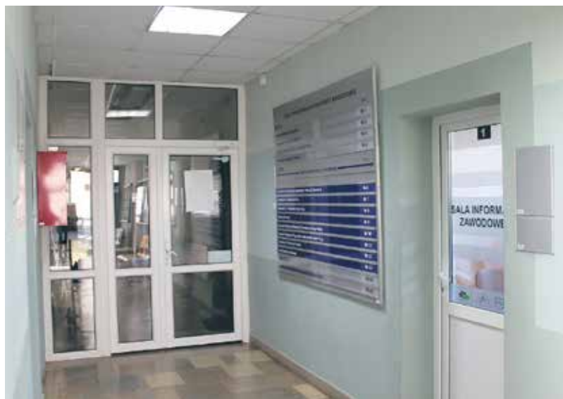
W PUP już od wejścia dobra informacja