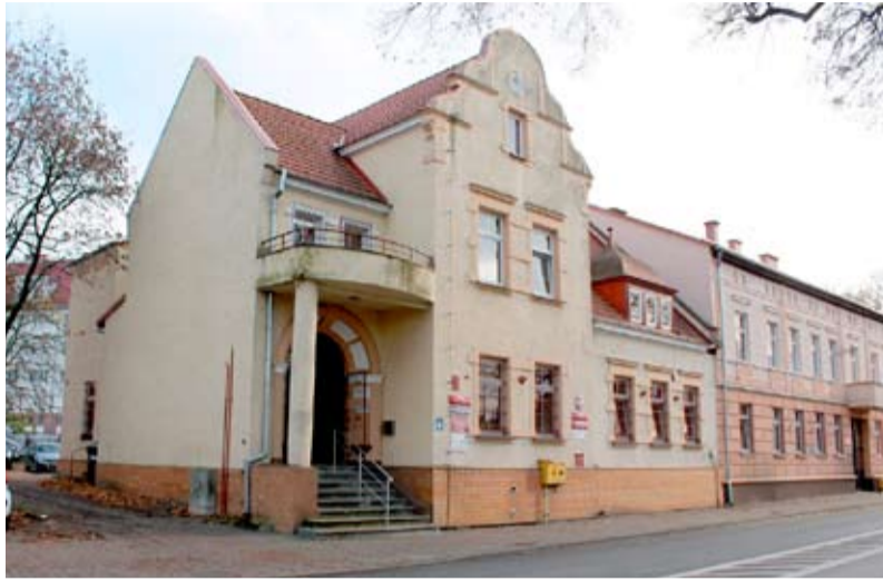
Ośrodek Pomocy Społecznej w Nowogardzie

Staż (bon stażowy) , najbardziej popularna forma aktywizacji zawodowej. Oferta ta jest skierowana głównie do osób, które nie przekroczyły 30 roku życia, choć pojawiają się także staże dla osób starszych, finansowane z Funduszu Pracy. Przyznanie takiego Bonu Stażowego gwaran-