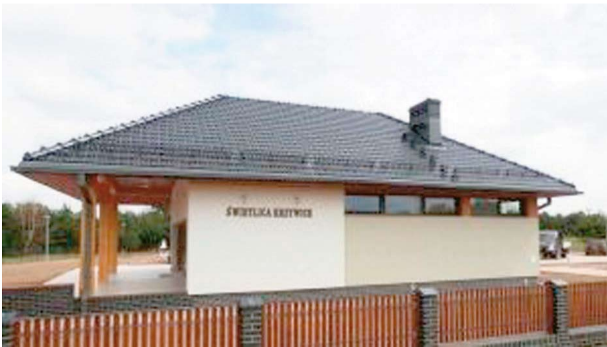
Świetlica w Krzywiczach, gmina Osina, wybudowana z funduszy PROW

można bez wstydu zaprosić osoby z odczytami czy na spotkania literackie.